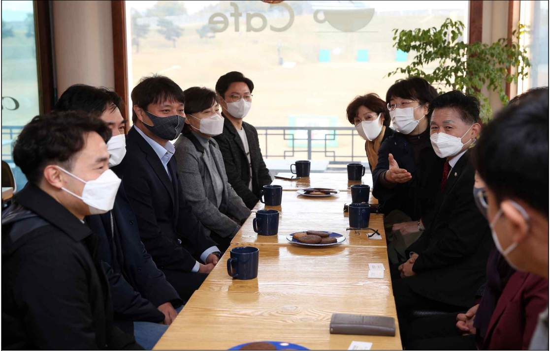
자치분권의정연구회 수원시 비교견학