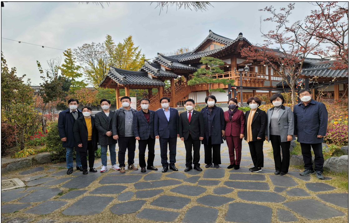
자치분권의정연구회 수원시 비교견학